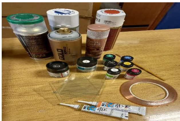
Slika 1. Pribor i materijal