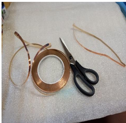
Slika 3. Priprema bakrene trake