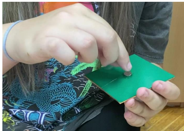
Slika 8. Lijepljenje magneta