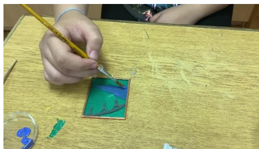
Slika 5. Oslikavanje pločice