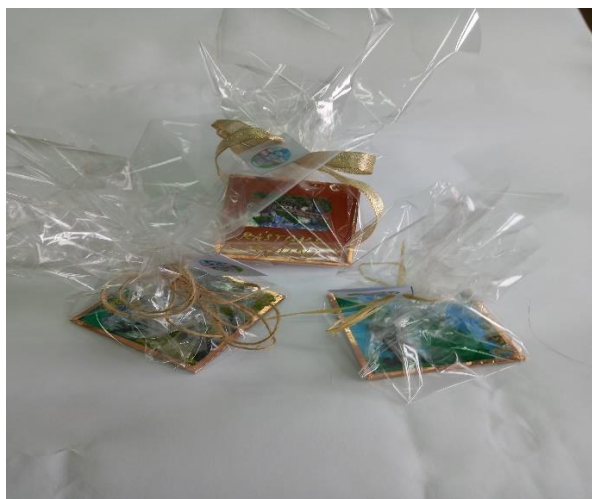
Slika 10. i 11. Proizvodi s cijenom u deklaraciji i ambalažom