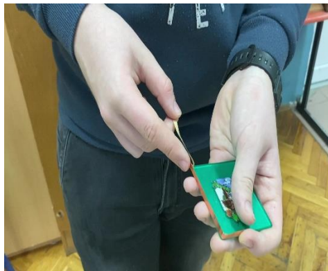
Slika 4. Lijepljenje bakrene trake