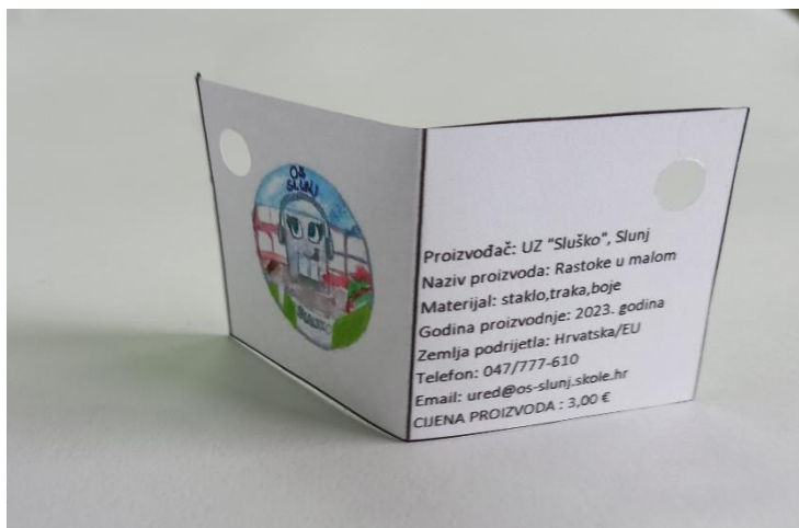
Slika 9. Deklaracija proizvoda