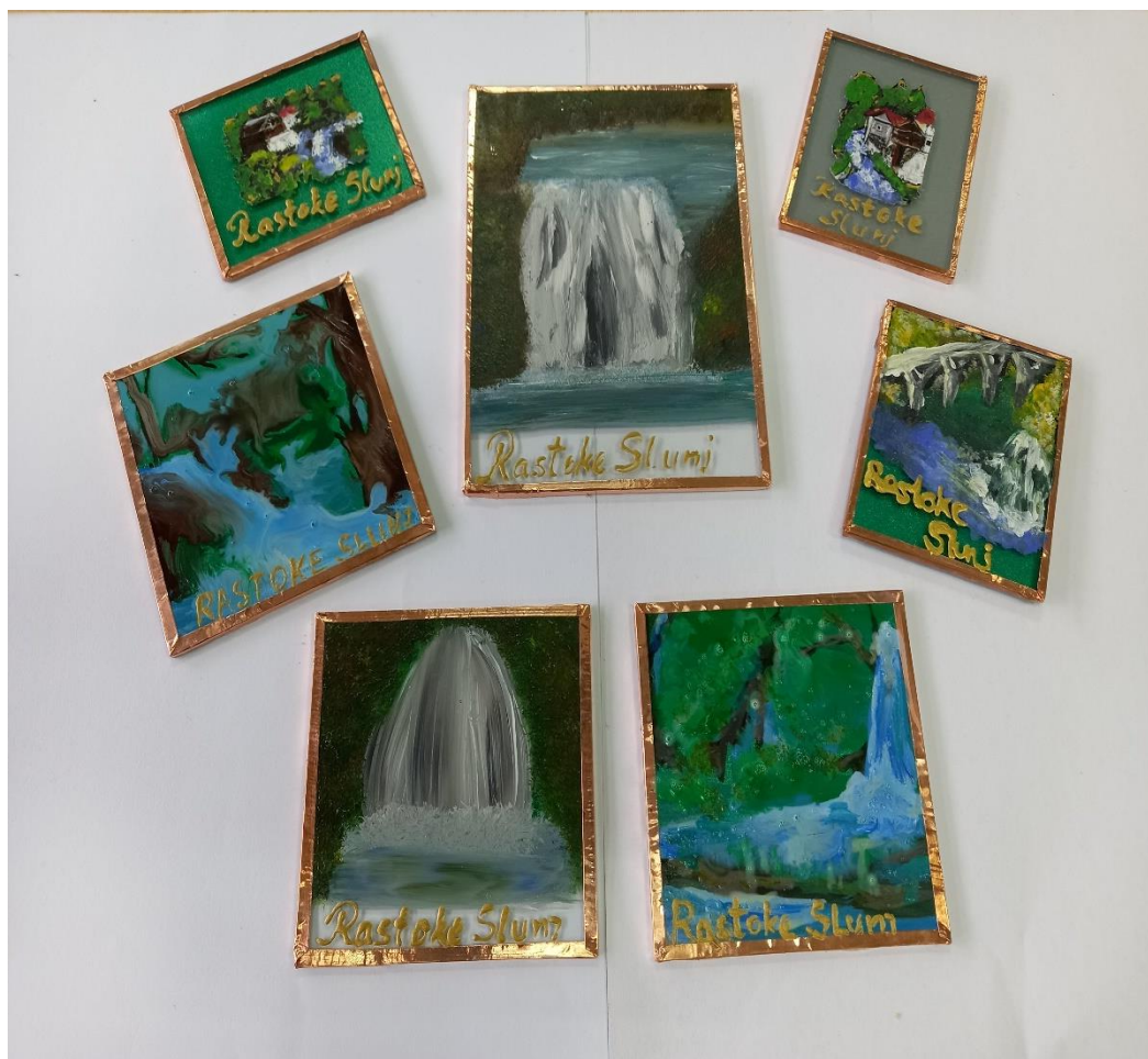
Slika 12. Rastoke u malom

Slika predstavlja oslikane, različite motive Rastoka. Njihova ljepota ne dolazi do izražaja u ambalaži, stoga ističemo raznolikost oslikanih prirodnih ljepota u mini formatu, „Rastoke u malom“.