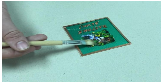
Slika 7. Uporaba laka za čamce